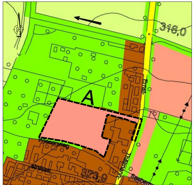
Ausschnitt aus dem wirksamen FNP 2006