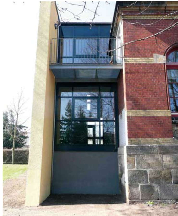
Neuer Eingang Anbau