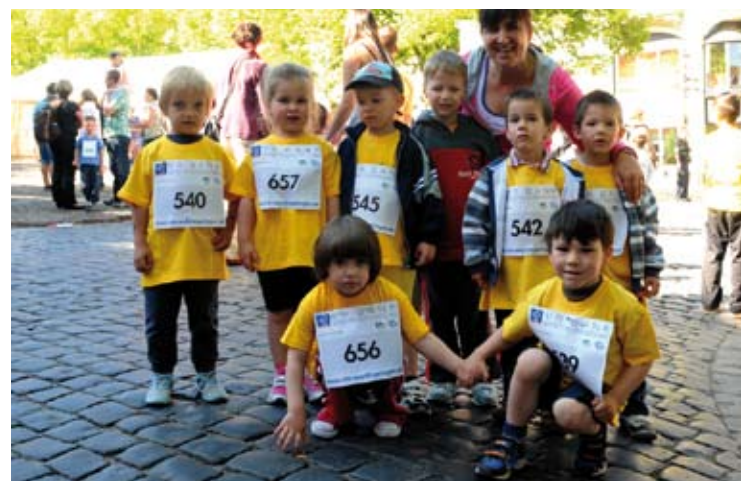
Citylauf Gotha