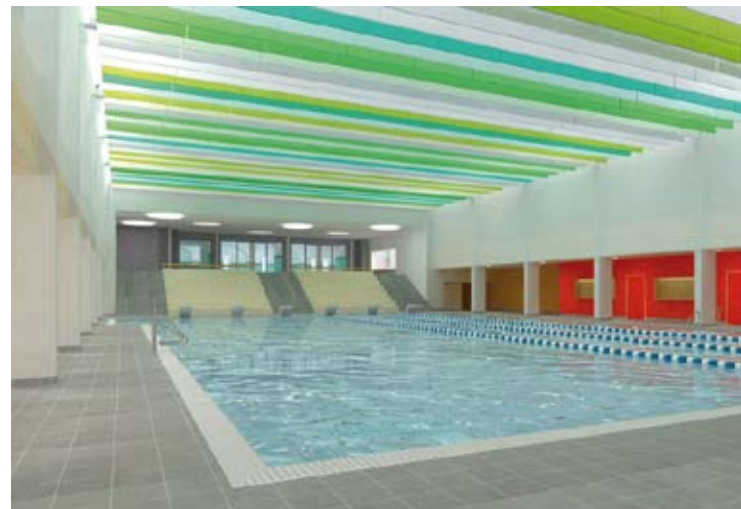
Sportbad / Freitreppenanlage