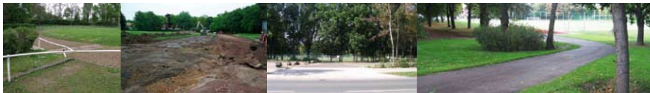
Törpe-Sportplatz vor und während der Sanierung