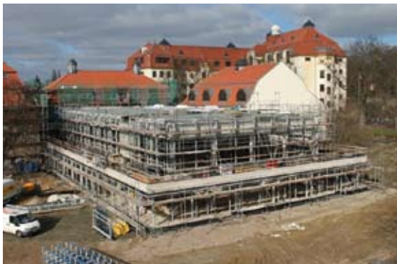
Baufortschritt März 2012

Mit dem Ersatzneubau für die Schwimmhalle Gotha – dem Stadt-Bad in der Bohnstedtstraße – als Sport- und Familienbad, wird ein neues sportliches Kleinod für die Einwohner, Besucher und Sportler der Stadt Gotha geschaffen. Voraussichtlich im Herbst 2012 wird das „Stadt-Bad“ seiner Bestimmung übergeben. Ein Sport-, Lehr-, Kinder- und Gesundheitsbecken stehen dann zur sportlichen Betätigung zur Verfügung. Entspannen können die Besucher im historischen Saunabereich.