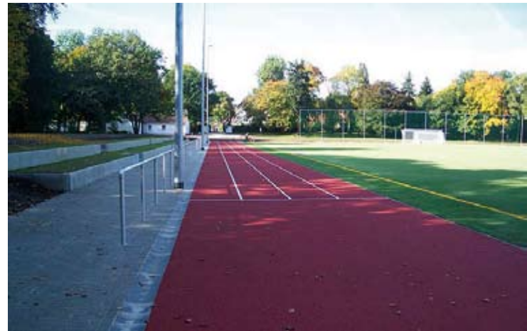
Törpe-Sportplatz nach der Sanierung

Im Rahmen des Konjunkturprogramms II der Bundesregierung wurde der Törpe-Sportplatz in der Leinefelder Straße grundhaft saniert und im Oktober 2010 wieder zur Nutzung freigegeben. Restarbeiten am Kunstrasenplatz und die Schaffung einer Zufahrt im hinteren Bereich des Sportplatzes mit Parkplatz an der Kindleber Straße realisierte die Stadt Gotha 2011. Zur fachgerechten Pflege des Kunstrasenplatzes war es notwendig das entsprechende Pflegegerät anzuschaffen.