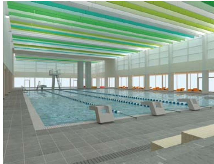
Sportbad / Blick auf den Sprungturm