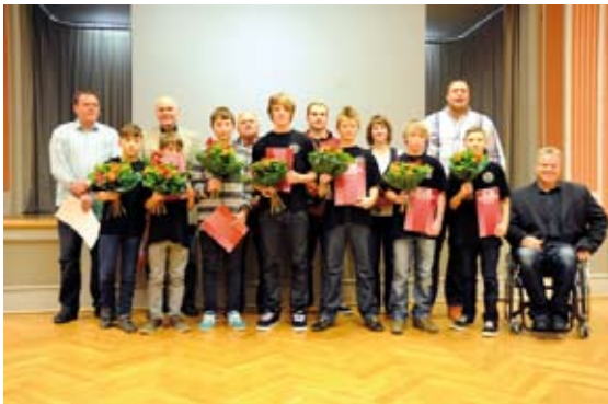
Sportlerehrung 2011

Die Voraussetzungen für die regelmäßige Durchführung des Sportgeschehens und die Vereinsarbeit sichert die Stadt Gotha mit der Bereitstellung der Sportstätten. Hier fließen die Kosten für die Betreibung, Wartung, Pflege und Instandhaltung sowie die Investitionen mit ein.