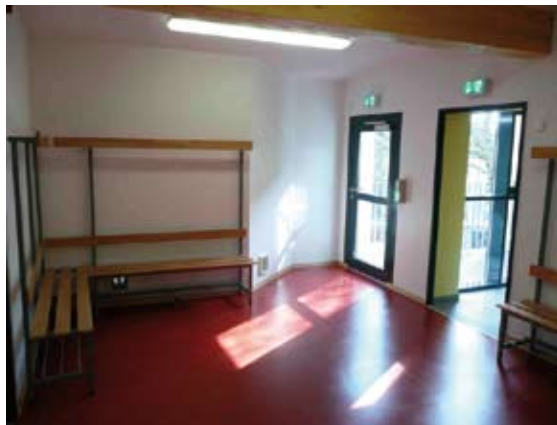
Neue Umkleideräume Anbau

Im April 2011 fand die feierliche Übergabe der Turnhalle an die Schüler und Lehrer der beiden Schulen statt.