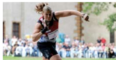
Gothaer Kugelstoßmeeting