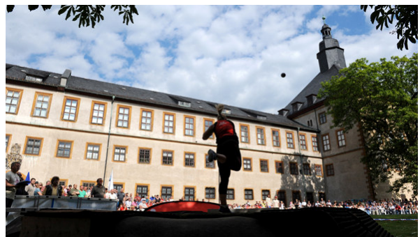
Gothaer Kugelstoßmeeting, Foto: Wolfgang Gleichmar

Nadine Kleinert hat an allen 15 Meetings in Gotha teilgenommen und 10 Siege mit nach Hause genommen.