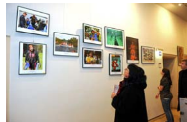
Gothaer Sportlerehrung