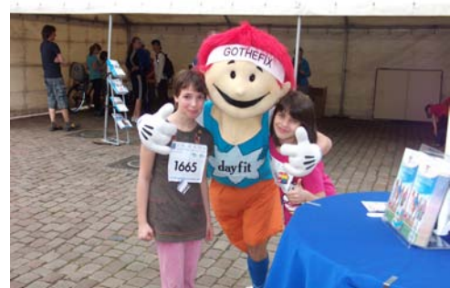
Citylauf Gotha, Fotos: wedea-Werbung u. Design GmbH