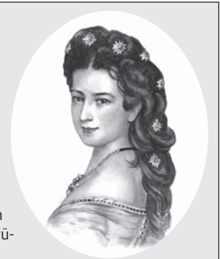
Zeichnung: Natali Schmidt

der Tourist-Information am Hauptmarkt. Der Erlös der Veranstaltung wird wieder einem sozialen Zweck zur Verfügung gestellt.