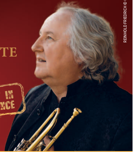
REINHOLD FRIEDRICH