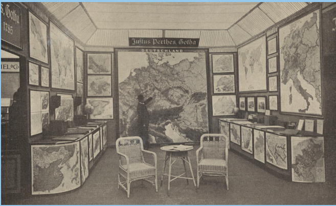
Stand von Justus Perthes auf der Weltausstellung für Buchgewerbe und Graphik in Leipzig im Jahr 1914

Krise, so scheint es, ist gegenwärtig das Schlagwort zur Charakterisierung der globalen Gegenwart. Die Welt wird gefühlt komplizierter und unüberschaubarer. Ein Medium, das in diesem Zusammenhang wieder stärkere Aufmerksamkeit erfährt, ist die Landkarte. Sie vermitteln uns das Gefühl, komplexe Phänomene, Strukturen und Gefahren lokalisieren und kontrollieren zu können.