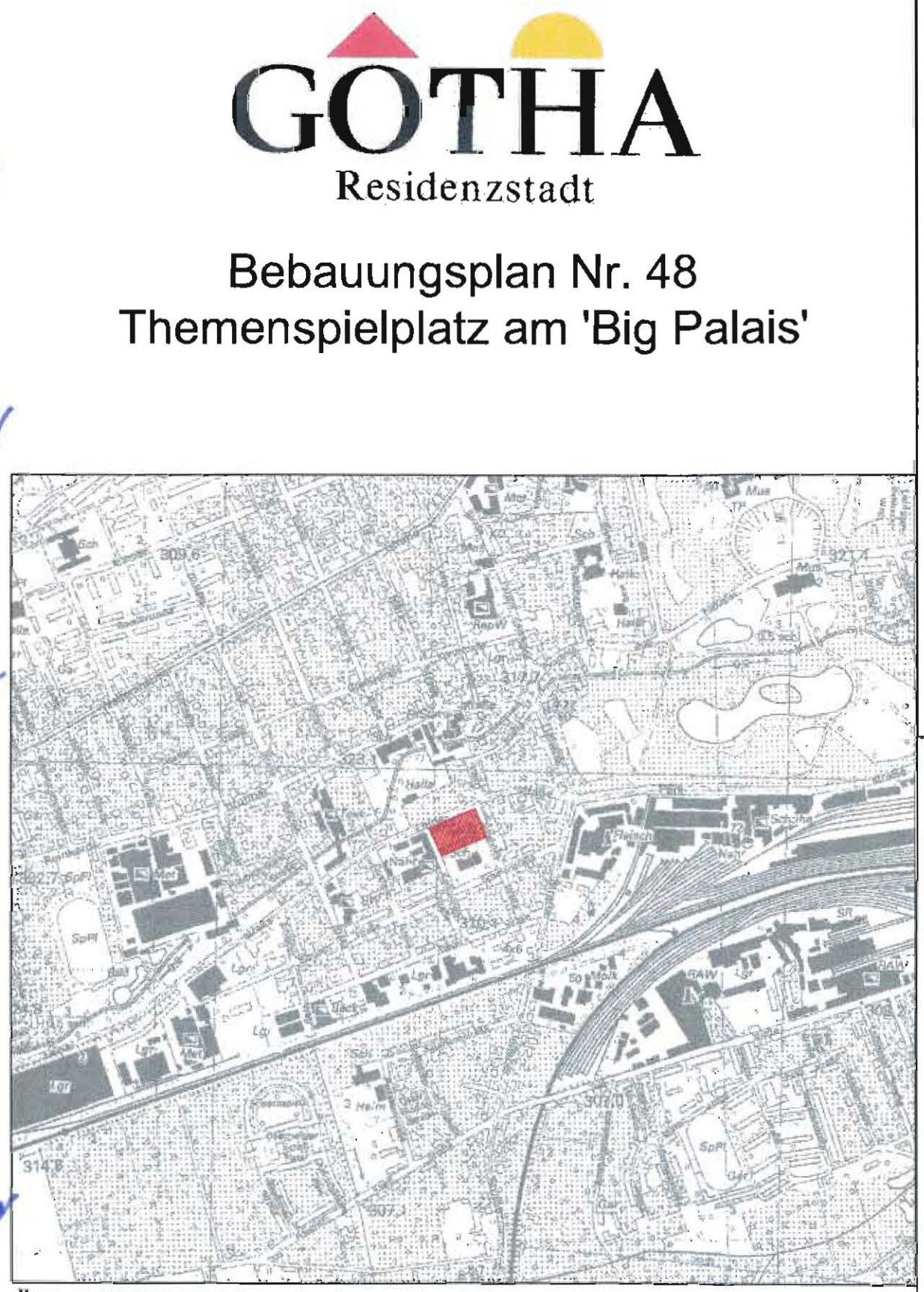
Übersichtslageplan Gotha 1:10.000